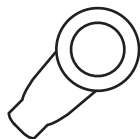
Skica 1 - alat za podešavanje napona

Proverite koliki je radni napon uređaja koji želite priključiti. Pomoću priloženog alata (skica1) ili šrafciģera podesite obrtni prekidač (žute boje) na odgovarajući napon. Na kraj kabla postavite odgovarajući konektor koji odgovara utičnici uređaja koji želite napajati. Untrašnji deo konektora je (+), dok je spoljašnji (-) (skica 2). Uverite se da najpre znate polaritet utičnice uređaja koji želite napajati, kako biste izbegli neželjene kvarove. Nakon spajanja povežite strujni ispravljač u strujnu utičnicu. Upotrebljivo isključivo u suvim, zatvorenim prostorijama. Odstranjivanje kućišta uređaja je opasno po život. Nikad ne rastavljajte uređaj, eventualne popravke prepustite stručnom licu. Zabranjena upotreba oštećenog uređaja, oštećeni uređaj isključite iz struje i obratite se stručnom licu. Za čišćenje koristite mekane suve krpe, ne koristite agresivna hemijska sredstva.